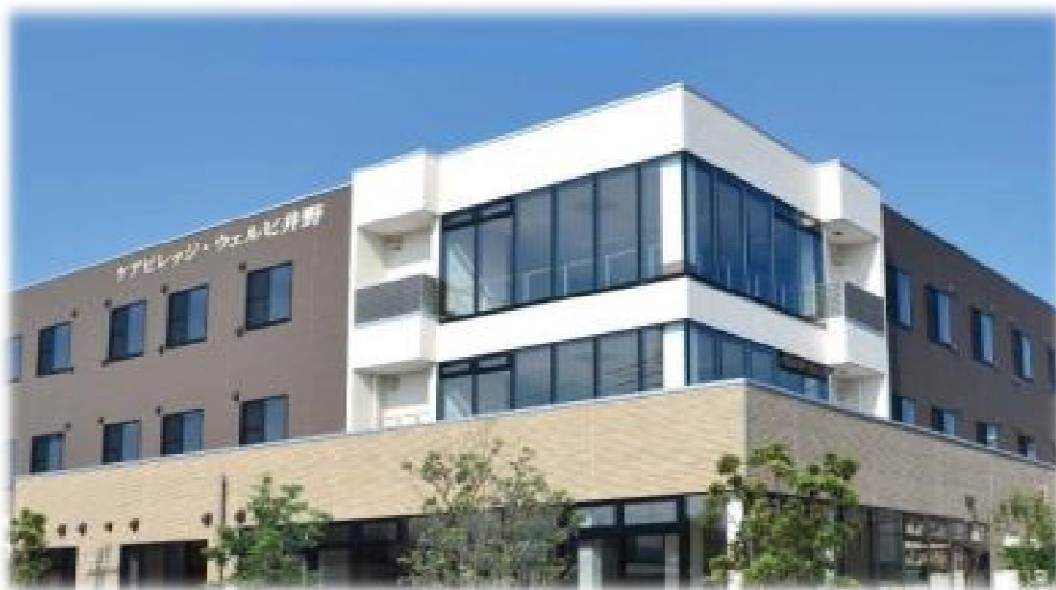
写真「ケアビレッジ・井野」